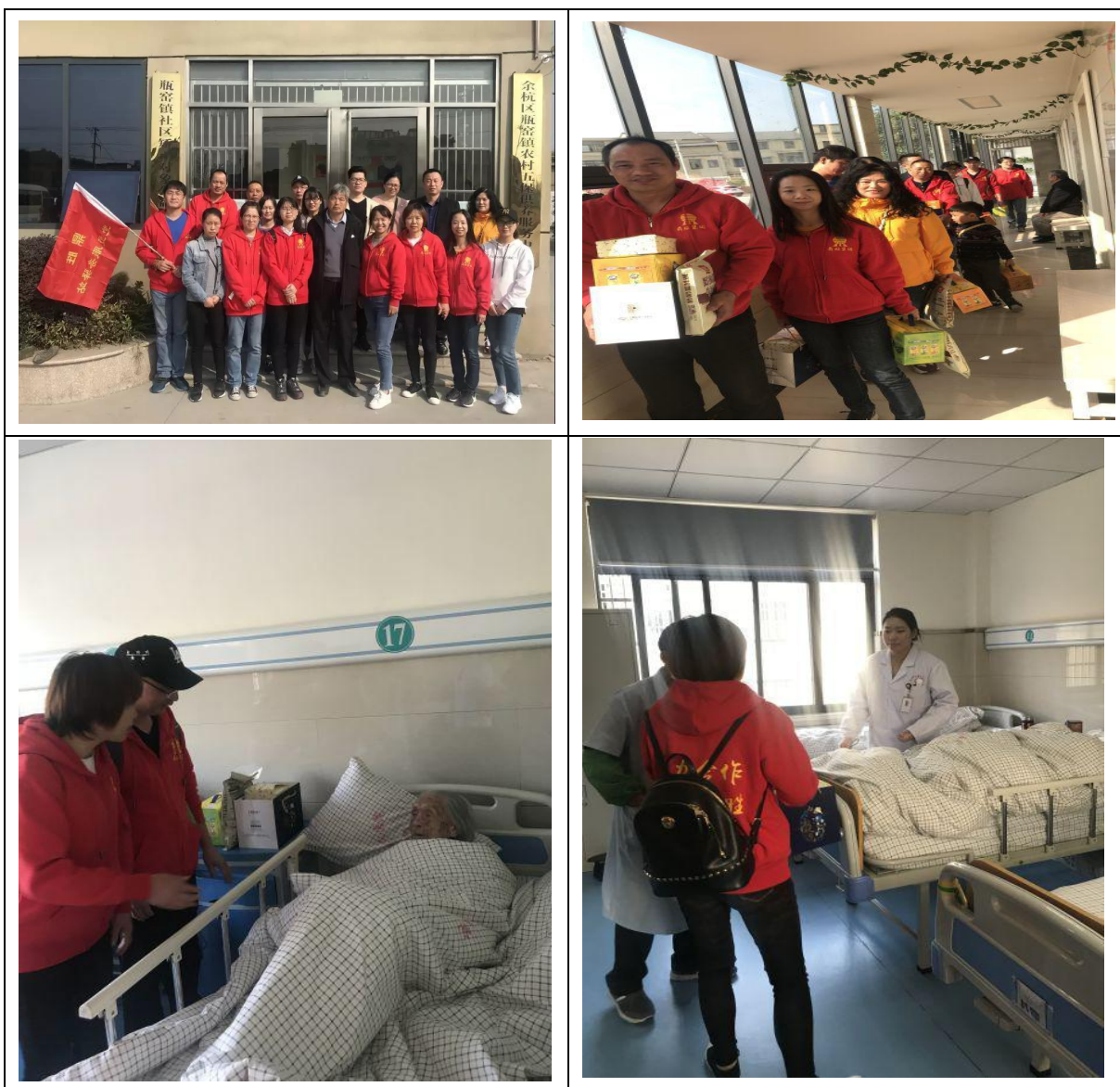
图表 15 慰问养老院