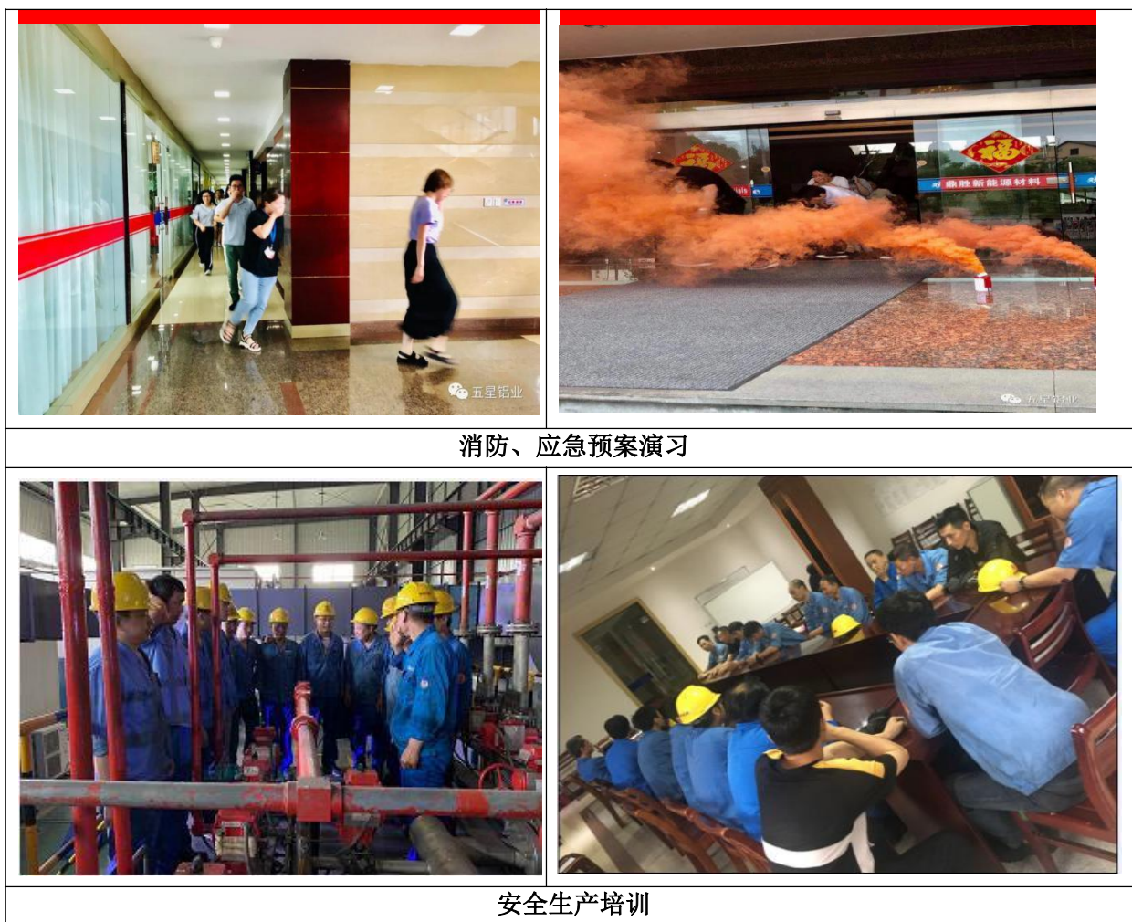
图表 11 鼎福铝业消防、应急预案演习