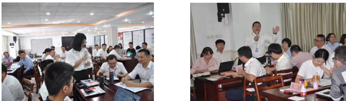
高效能销售实战技巧培训