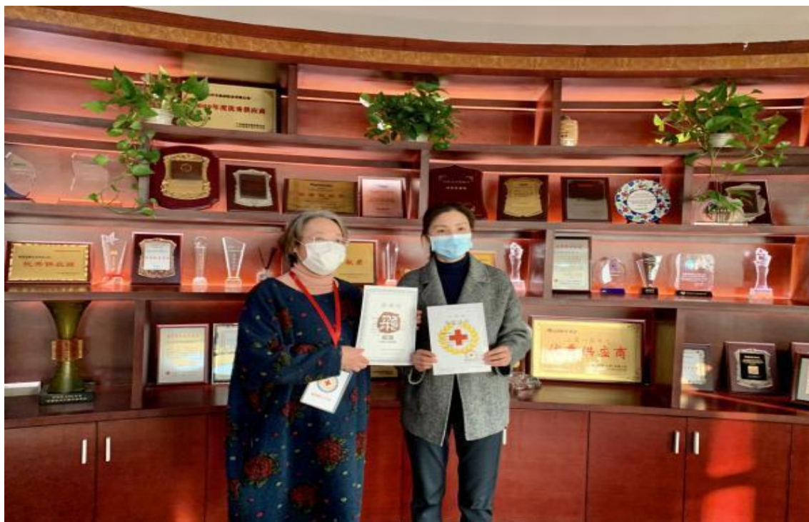
图表 16 防疫公益